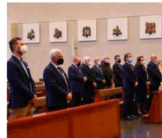
I partecipanti alla funzione religiosa