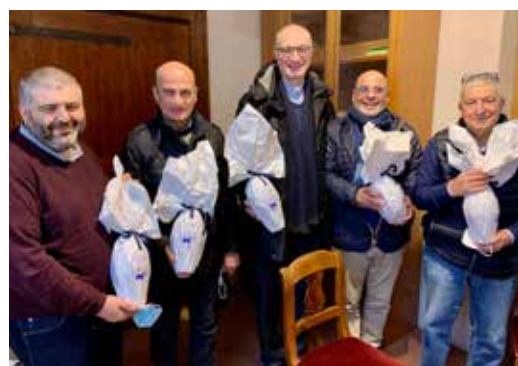
Donazione alla Parrocchia della Cattedrale