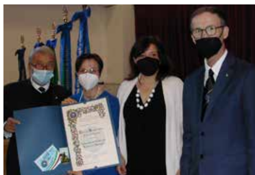
Consegna Premio Bontà UNCI Trento all'associazione Levico in famiglia