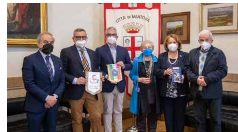
La delegazione UNCI con il Sindaco di Mantova Mattia Palazzi