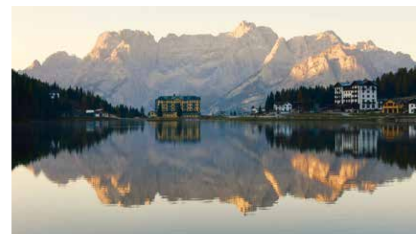
Lago di Misurina

Sono le montagne che fanno da sfondo a magiche sciate. Non per niente ci sono le piste più belle e affascinanti del pianeta. Ma le Dolomiti bellunesi non sono solo sci (e non soltanto sci di discesa, visto che sono numerose le alternative per gli amanti del fondo). D'inverno, quando la neve imbianca prati e boschi, le camminate con le ciaspe sono una validissima alternativa, per raggiungere i rifugi in quota o più semplicemente per scattare qualche foto scenografica, o ancora per raggiungere i boschi secolari. Come la foresta di Somadida, riserva naturale attornata dalle maestosità delle montagne di Auronzo, che per secoli