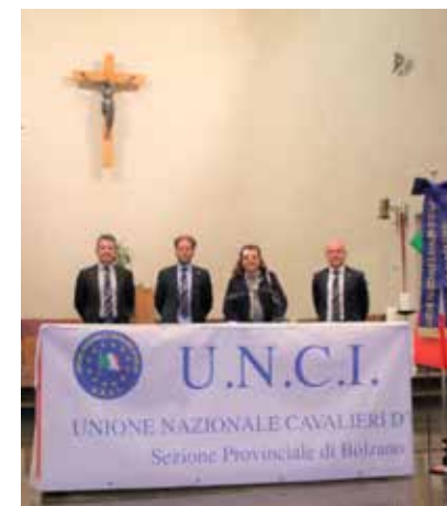
Parte del CDS UNCI Bolzano