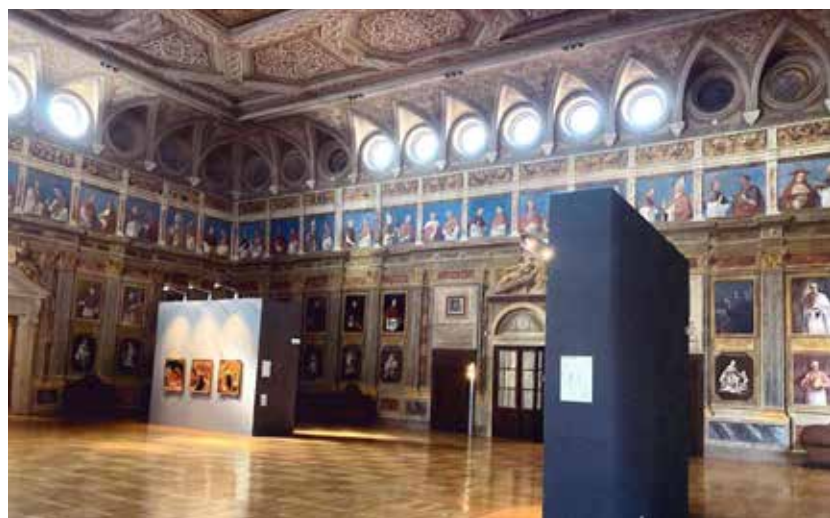
Salone dei Vescovi

Giovedì 2 giugno 2022 in Piazza dei Signori a Padova, alla presenza del Prefetto dott. Raffaele Grassi e del Sindaco dott. Sergio Giordani, sono state consegnate le onorificenze dell'Ordine al Merito della Repubblica Italiana.