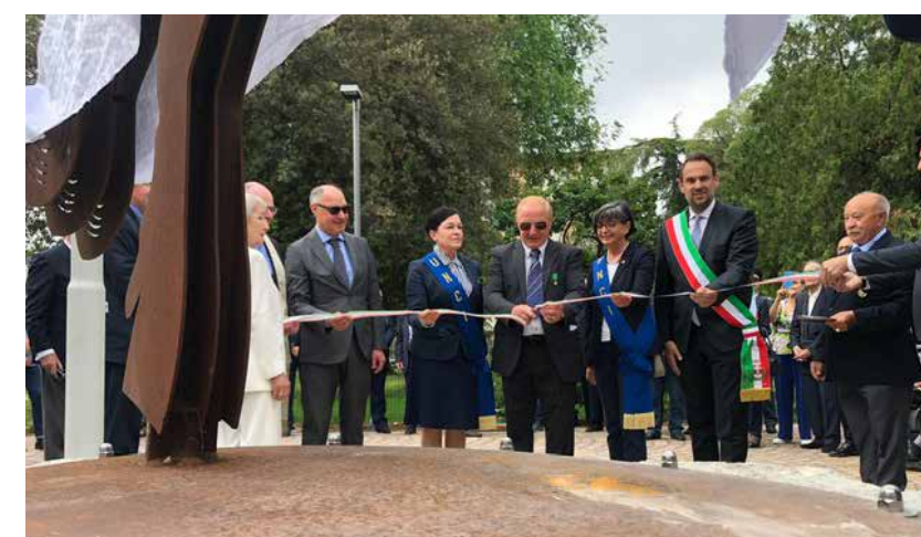
Taglio del nastro