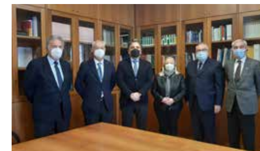
I consiglieri dell'UNCI Lodi con il Prefetto Giuseppe Montella

Un incontro molto cordiale nel quale il Prefetto ha evidenziato l'importanza della presenza sul territorio di associazioni di volontariato che si prodigano per il bene comune; ha inoltre sottolineato come le finalità molto significative della nostra associazione siano un indice di attenzione verso la comunità in