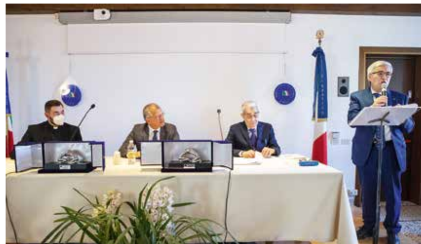
Tavolo delle autorità