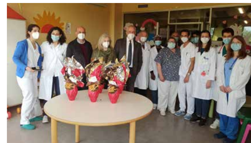
Il personale delle Pediatrie