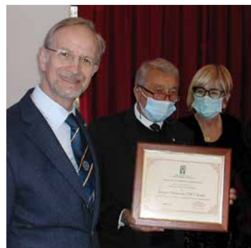
Consegna riconoscimento speciale AISLA all'UNCI Trento