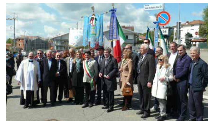
Autorità e consiglieri dell'UNCI

rico del luogo con un ricco, tipico menù gastronomico bergamasco. ◆