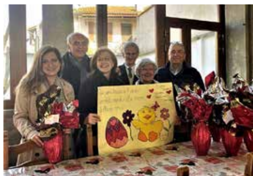
Madre della Pietà Celeste Onlus

ri, in un ambiente accogliente. A ogni bambino viene garantito, in collaborazione con i servizi sociali di riferimento, un percorso individuale nel rispetto dei suoi bisogni e della sua storia di vita, che contempra il benessere psicologico e fisico e, là dove possibile, la ricostruzione della relazione con la famiglia d'origine.