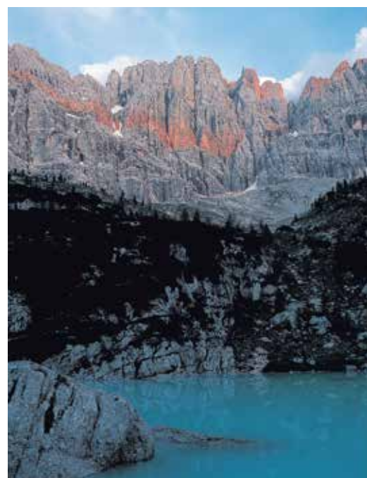
Dolomiti settentrionali, lughetto di Sorapis

Ma non c'è solo Cortina: la parte alta del Bellunese è costellata di deliziosi paesi alpini, ognuno con un passato degno di essere scoperto. Ognuno con una vetta dolomitica di riferimento. Il Civetta, per esempio, che si specchia nelle acque limpide del lago di Alleghe e si staglia maestoso con pareti che hanno segnato pagine della storia dell'alpinismo; attorno al Civetta l'omonimo comprensorio sciistico, il più esteso del Veneto, che ogni inverno richiama turisti e appassionati del "circo bianco" da tutta Europa. La Marmolada (la cima più alta di tutte le Dolomiti) con il suo ghiacciaio: da Punta Rocca, "tetto del mondo", si può ammirare un panorama mozzafiato su tutte le