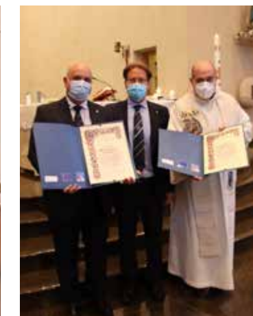
Consegna diplomi ai neo iscritti all'UNCI