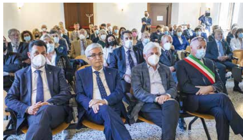
Pubblico in sala

ad oggi, riveste il compito di consigliera per la stabilizzazione NATO, presso il comando strategico Shape a Mons in Belgio. Ha operato in Palestina, Afghanistan, Iraq, Mauritania, Messico e Venezuela, per il Ministero degli Affari Esteri Italiano e per l'Unione Europea. Per la sua attività nell'ambito di diritti umani e protezione dei civili ha ottenuto recentemente il premio internazionale Lazaref.