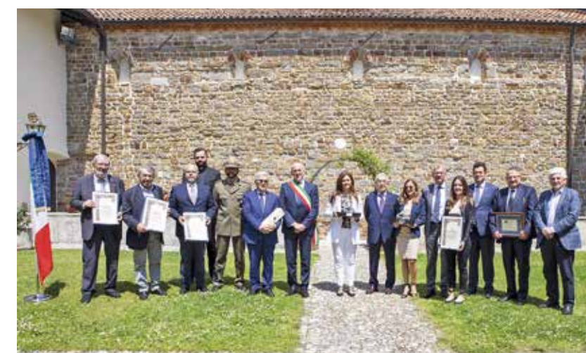
I premiati e nuovi soci con le autorità