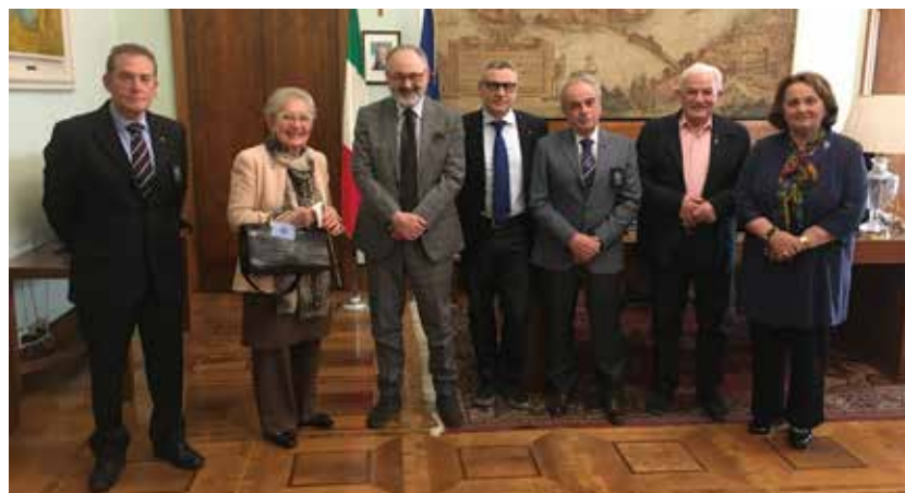
La delegazione UNCI con il Prefetto di Mantova dott. Gerlando Iorio