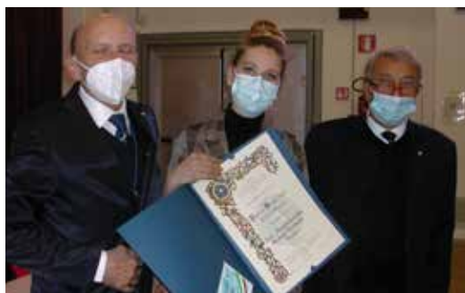
Consegna Premio Bontà UNCI Trento all'associazione Club Alcologici territoriali & di Alcologia familiare del Trentino

Nel corso dell'assemblea sono stati consegnati i Premi Bontà UNCI - città di Trento, all'associazione Club Alcologici territoriali & di Alcologia familiare del Trentino, all'associazione Levico in famiglia e alla sede per il Trentino Alto Adige di AISLA - Associazione Italiana per la Sclerosi Laterale Amiotrofica. ♦