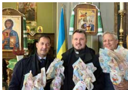
Donazione alla Parrocchia di San Giorgio