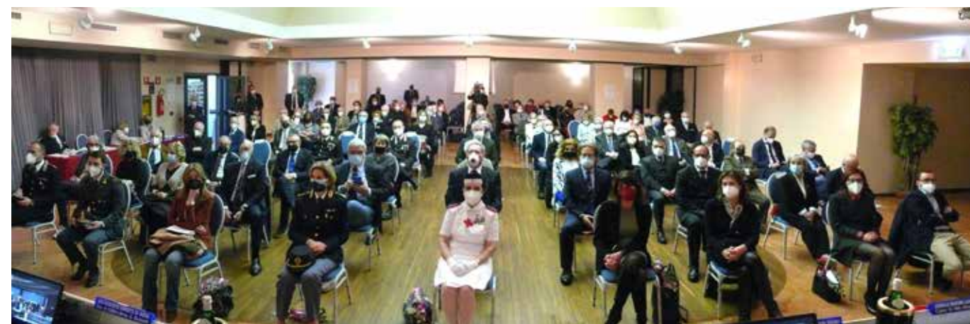
Pubblico in sala

in ricordo dell'uff. don Lino Lazzari e dei soci che ci hanno lasciato; 7 Premi della Bontà UNCI - Città di Bergamo; il Premio Solidarietà all'ARMR - Aiuti per la Ricerca sulle Malattie Rare; Associazione Franco Pini per i bambini di Nyagwehe in Kenya; il contributo alla Fondazione Comunità Bergamasca per l'emergenza Ucraina; a Casa Mater che accoglie donne con figli in difficoltà.