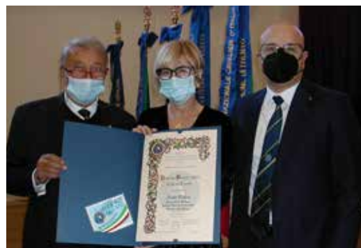
Consegna Premio Bontà UNCI Trento ad AISLA TAA