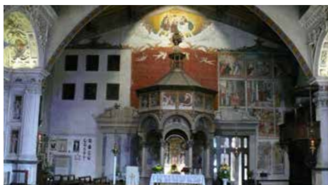
Interno del Santuario Madonna del Castello

Successivamente, a cinquecento metri di distanza, sorge la chiesa di San Giorgio circondata dalla campagna, ricca di affreschi e pitture medievali. Arrigoni ha spiegato che durante gli scavi si sono rinvenuti una tomba longobarda di ragguardevoli dimensioni e i muri della precedente chiesa dedicata a San Romolo. Particolare l'attenzione rivolta all'affresco di San Giorgio protettore dei Cavalieri, rappresentato anche sull'immagine della nostra preghiera. La cavalleria vide rappresentati i suoi ideali: il trionfo del bene che vince sempre sul male. Una visita resa ancora più interessante dopo la lunga sosta dovuta alla pandemia da Covid-19.