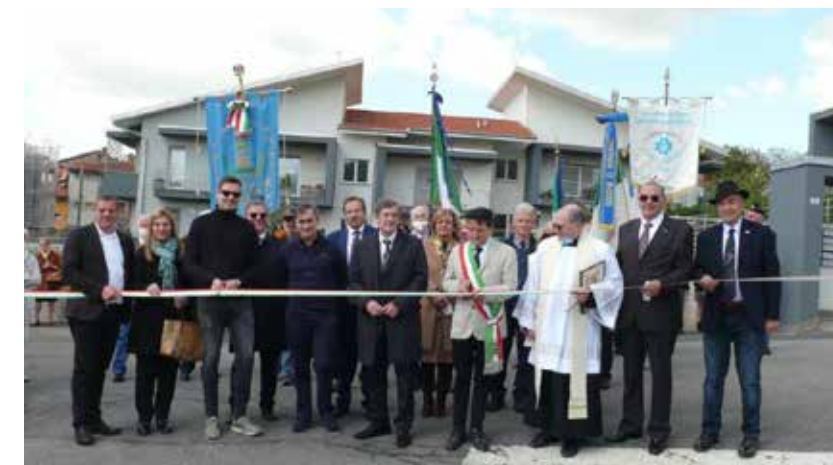
Il taglio del nastro