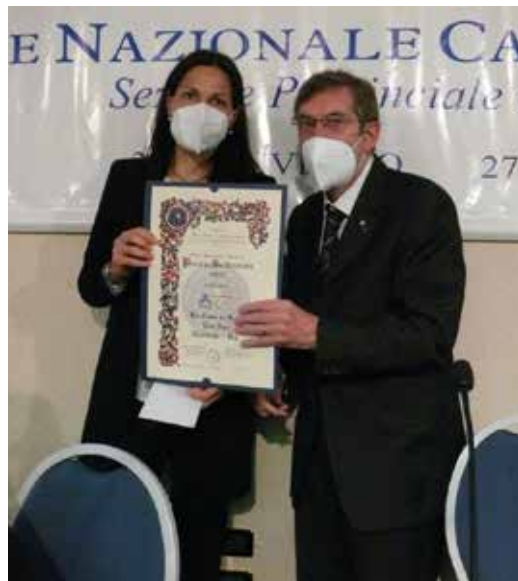
Premio Solidarietà a La CASA DI LEO - Eos Aps