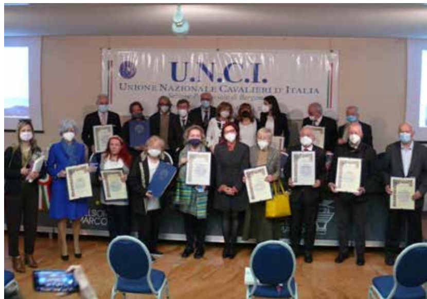
Gruppo dei premiati