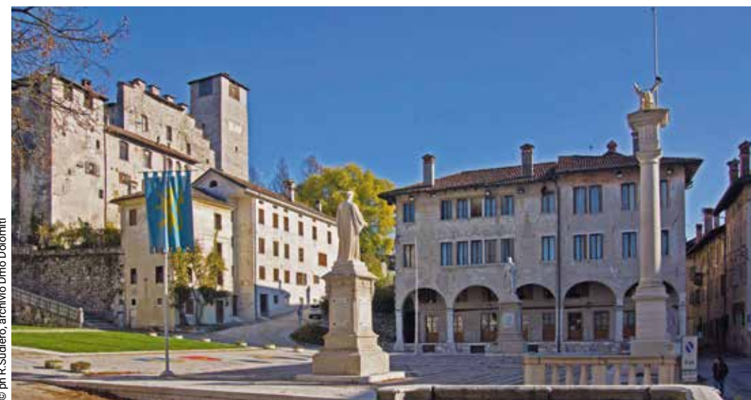
Feltre, Piazza Maggiore

Gli amanti della storia trovano grandi motivi di interesse anche a Feltre, il secondo centro della provincia, con un'anima veneziana: non tutti sanno che nella cittadella c'è il teatro della Fenice in miniatura. Proprio così, una copia esatta in cui il giovane Goldoni rappresentò alcune delle sue commedie. La cattedrale, invece, di origine antichissima, è inserita all'interno di una vasta area