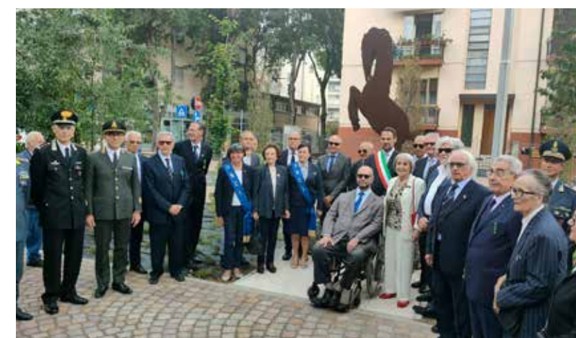
Inaugurazione del monumento