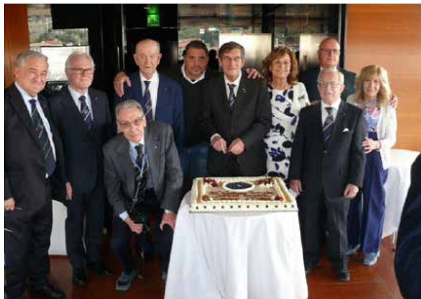
Il taglio della torta UNCI