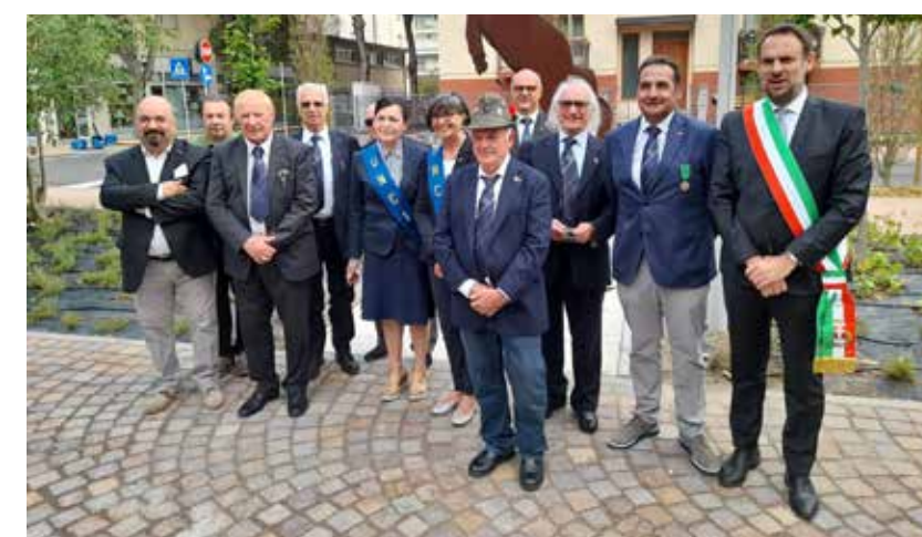
Il Consiglio direttivo all'inaugurazione del monumento