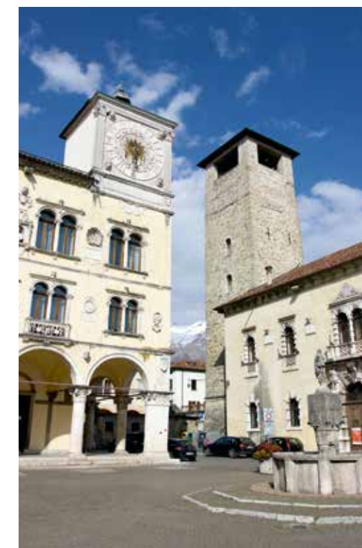
Belluno, piazza Duomo con angolo Prefettura-Auditorium

Proprio il capoluogo merita una visita a parte. Per un giro tra le piazze e le fontane, dove l'arco veneziano testimonia un passato glorioso a fianco della Serenissima, nonostante non siano più presenti i Leoni di San Marco, smantellati dai soldati napoleonici arrivati in città. Proprio le truppe di Napoleone sono protagoniste, loro malgrado, di un aneddoto curioso che riguarda due sculture spettacolari conservate nella chiesa di Santo Stefano (in centro città). Si tratta di due angeli, scolpiti dal "Michelangelo del legno" Andrea Brustolon. Oggi sono bianchi, color del marmo, mentre una volta erano del colore del legno, proprio perché i frati della chiesa li dipinsero con stucco e gesso così da farli sembrare di pietra... troppo pesanti per essere portati via come bottino dai soldati francesi. Sono tante le opere di Brustolon presenti in città, soprattutto nella chiesa di San Pietro, annessa al seminario. Mentre al Museo Fulcisi si può seguire la storia della città attraverso la collezione di spade (Belluno produceva