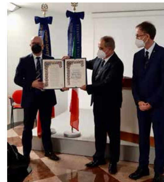
Consegna attestato di fondazione dell'UNCI Pesaro Urbino

In successiva sessione ordinaria, i consiglieri provinciali eletti hanno provveduto